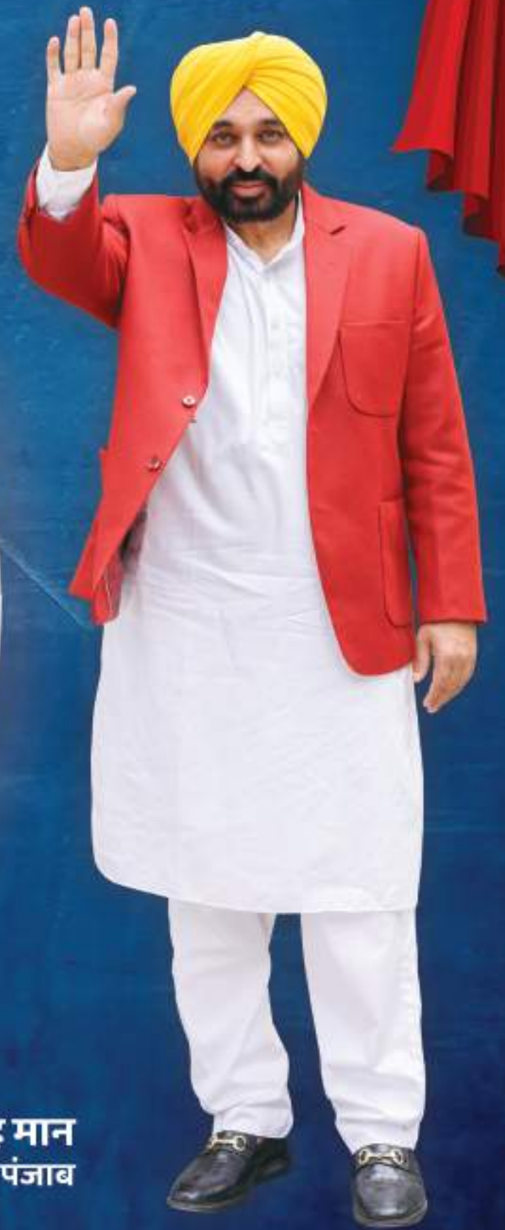
भगवंत सिंह मान मुख्य मंत्री, पंजाब