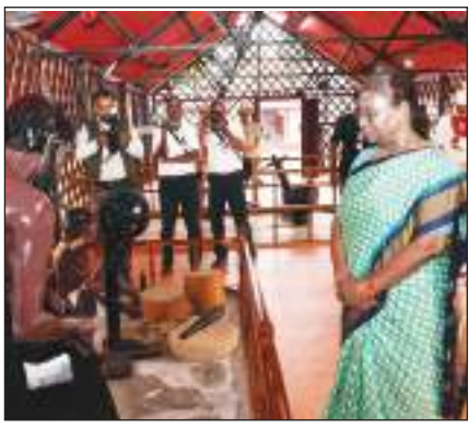
राष्ट्रपति द्रोपदी पोर्ट ब्लेयर में ऐतिहासिक जेल का दौरा करती हुई।