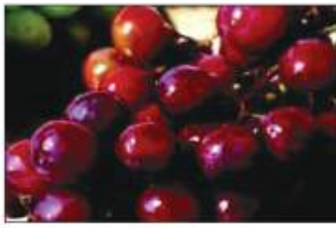
है और दिल की बिमारियों को होने से रोकता है।

इन वैज्ञानिकों का कहना है कि हमें दिन में कम से कम 30 ग्राम लाल अंगूर खाना चाहिए। यह स्वास्थ्य वर्धक है और दिल की बिमारियों को होने से रोकता है।